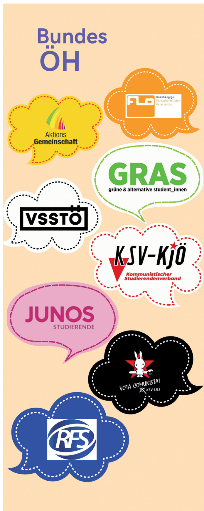
alle Grafiken zum Beitrag © Julie Häußler